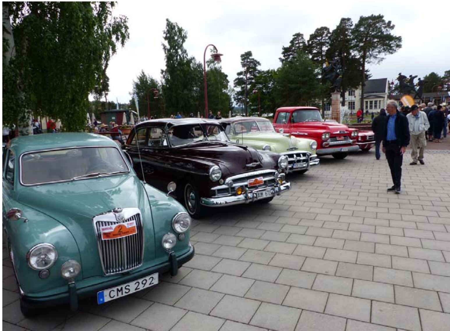
Deltagarna rullar in på plattan vid fontänen och inväntar resultaten