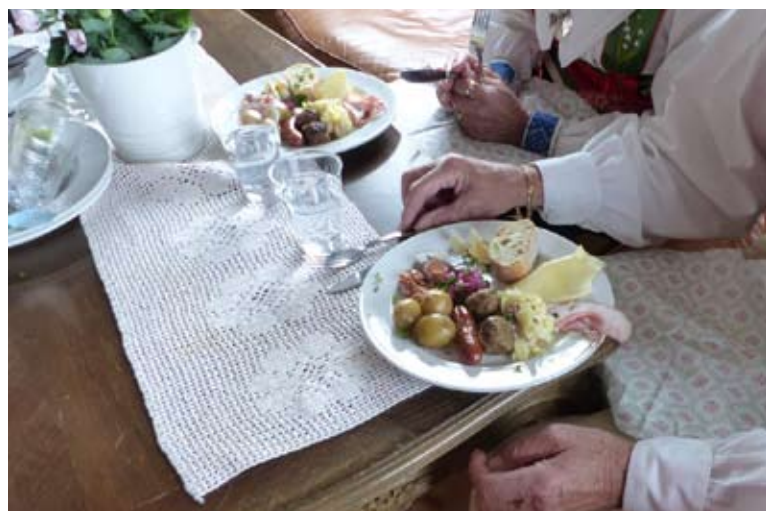
En typisk midsommarlunch serverades

Sen följde kontroller runt om i byarna till det var dags för lunchuppehåll uppe på Vidablick, där det bjöds på en midsommartallrik. Åter ut på vägarna för fler prov och till sist, slutprov och målgång vid fontänen i Rättviks centrum