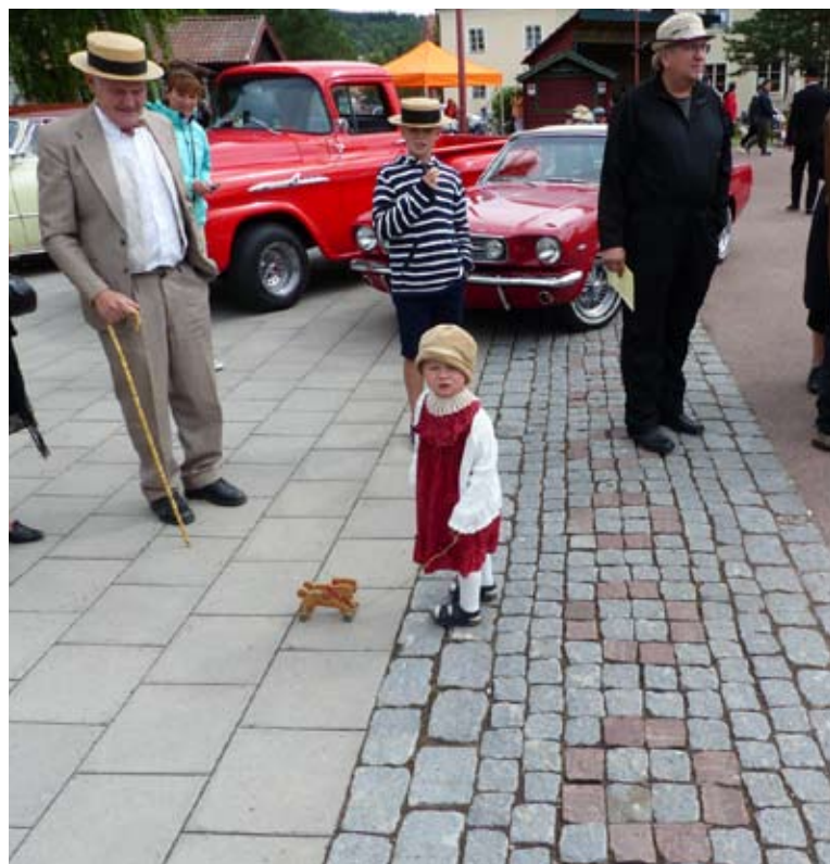
Ingen åldergräns här inte...