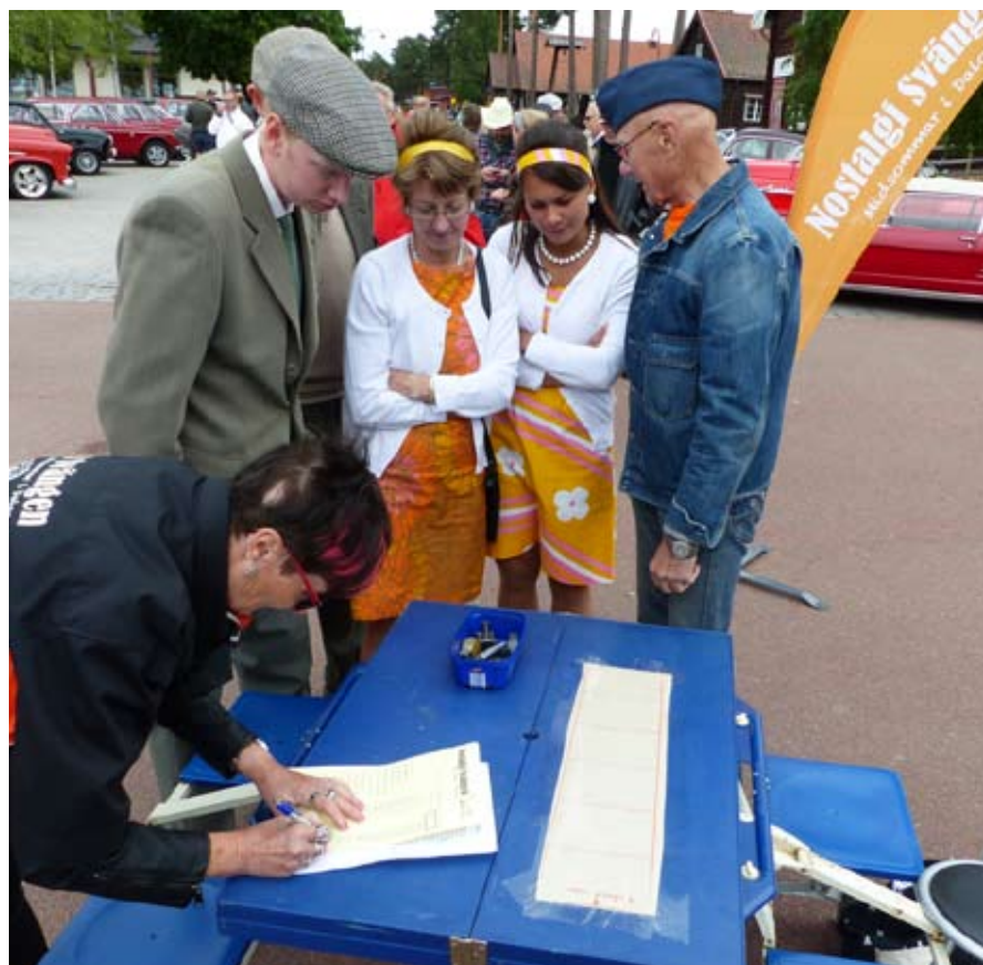
Bo Elwings slutprov med motordelar som skulle placeras höjdmässigt. T.ex. flottören som kom högst upp (motorn var ett Ford Y-block)