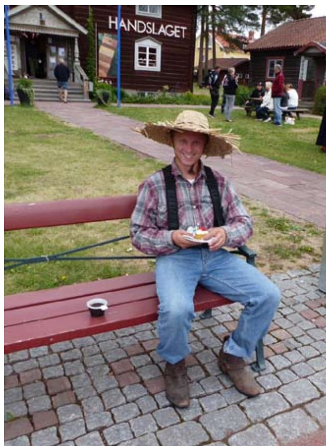
Kaffe och tårta vid målgång sitter fint när det blåser kalla vindar