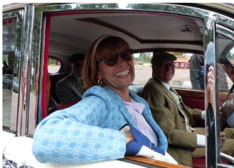
Arbetshandske och trång sittbrunn ställde till det för många