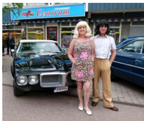
Firebird -69 med 2 stycken som verkligen visade upp hårmodet 1969