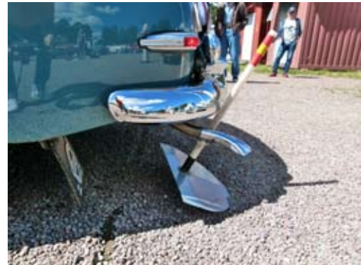
På knektplatsen var det parkeringsprov, i verkligheten skulle det ha blivit omfattande plåtskador på PV:n