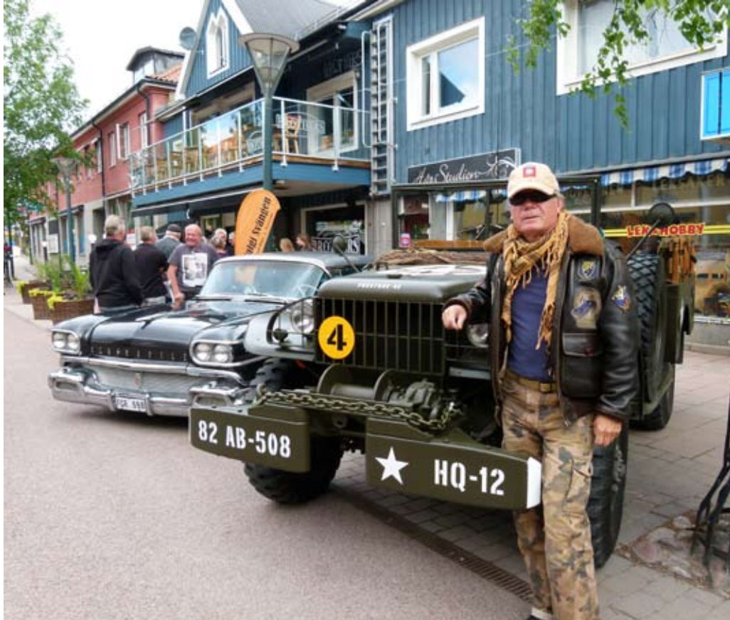
Ett schweiziskt par, kom in med sin Dodge Weapon Carrier på en återbudsplats

Åretsslingagick från bokstavsprovet vid Storgatan mot lokstallarna och kyrkan, där det var frågor. Sen bar det iväg mot Sätra där provet var kryddor, tillbaka mot Rättvik och Rättviks Arena med ett "boll"-prov. Vid XL-Bbygg var det identifiering av udda saker. Sen var det dags för lunchuppehåll på Knektplatsen med ett förarprov innan midsommartallriken och ett blomsterprov efter densamma. Vid Rättvik Bowling & Krog var det "skruvar o muttrar", upp till slalombacken där ett manöverprov genomfördes. Åter dags för en fråga vid Gettorget innan man skulle bestämma höjden på bilen vid OK/Q8 Hantverksbyn. Slutprovet, ett viktprov vid fontänen i centrala Rättvik.