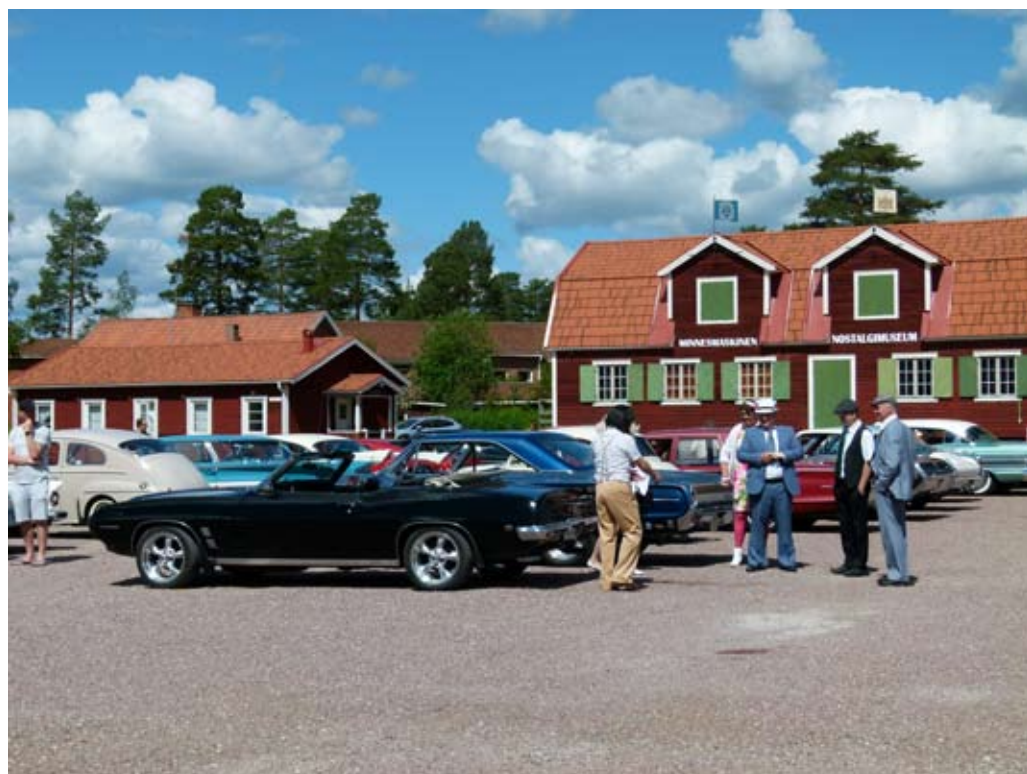
Vid Knektplatsen var det dags för lunch och ett prov före och ett prov efter maten. Givetvis i strålande midsommar sol