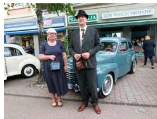
Paret Karlsson från Grycksbo, PV444CS